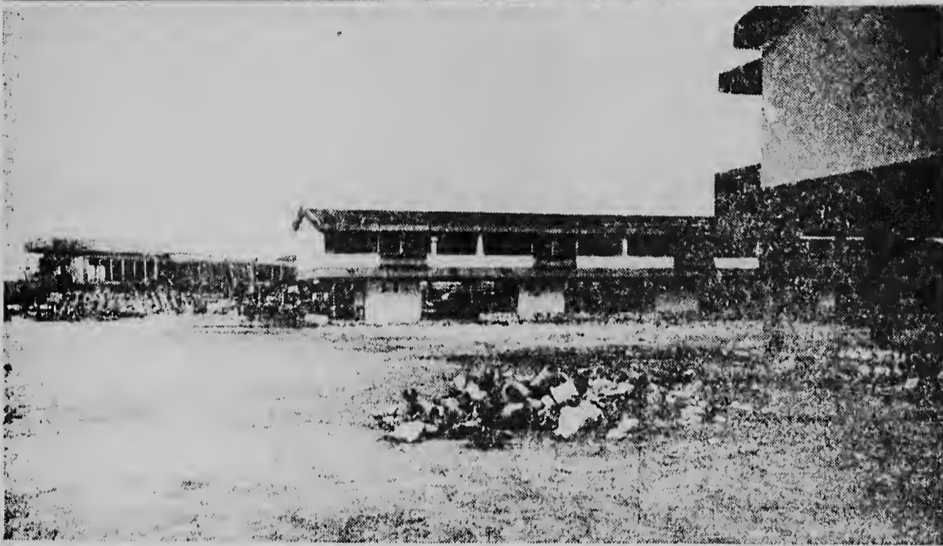
Parce cu Hotel Bonaire lo bini cu un cuminsamento di maart di 1963, esaki a worde participa door di e oficina di turismo di Bonaire. E hotel ta traha pa Hotel Maatschappij Bonaire. E dos portretnan aki ta duna un bista riba e hotel nobo cu ta worde traha den un estilo aparte y moderno.